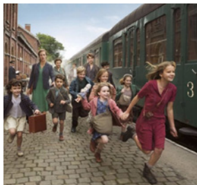
Bild från Fannys flykt