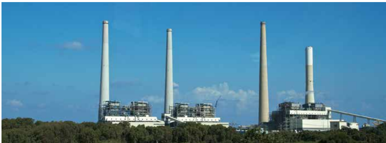
Under sina sex år i Israel bodde Andreas med sin familj i hamn- och industristaden Haifa